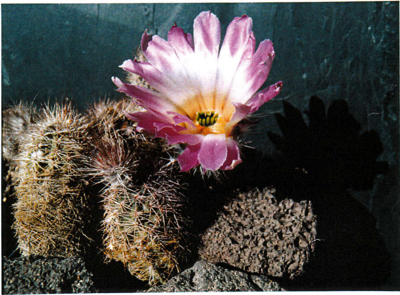
Echinocereus fobeanus in Blüte