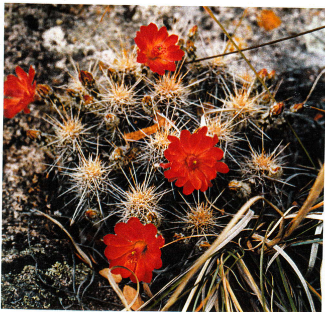
Echinocereus salm-dyckianus , Yepáchic