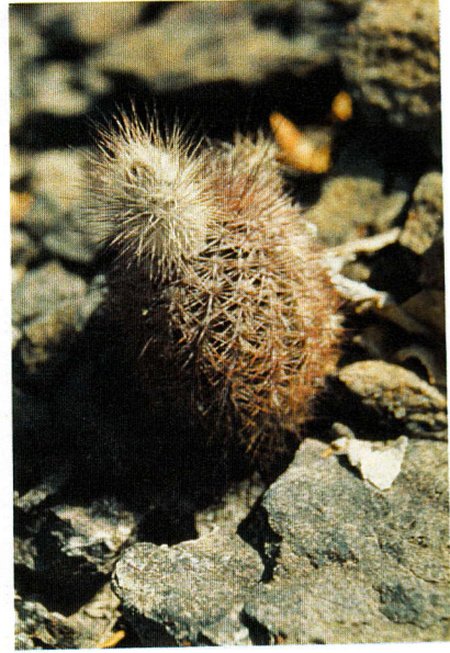
Echinocereus fobeanus am Standort