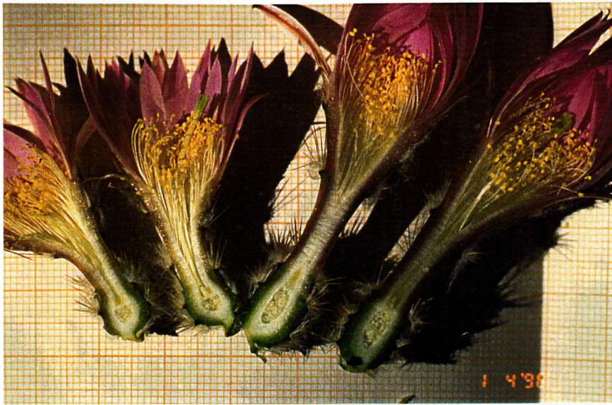
Echinocereus laui , Blütenschnitt