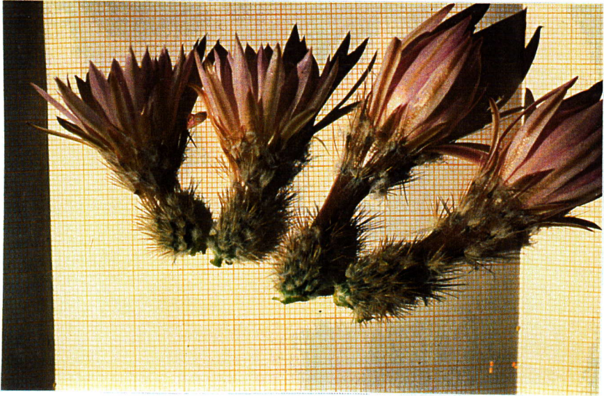
Echinocereus laui , Blütenschnitt