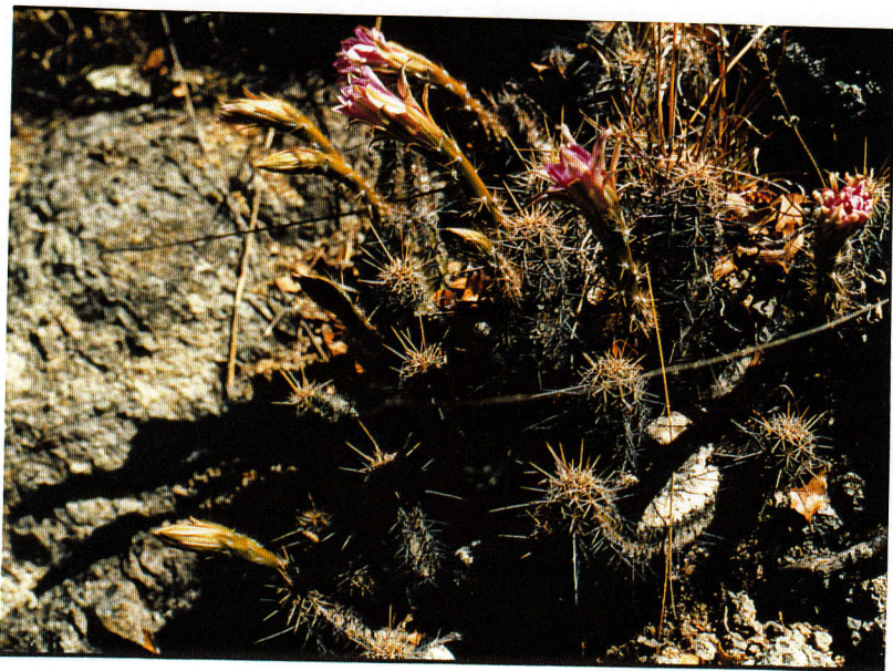
Echinocereus scheeri , Yepáchic